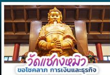
วัดแห่งกวงเมียว ขอโชคลาภ การเงินและธุรกิจ