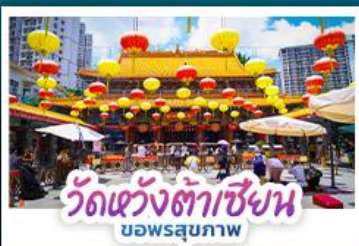
วัดแห่งต้าเซียน บอพรสุขภาพ