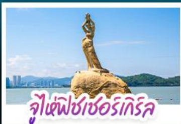
จุฬาราชมนตรี