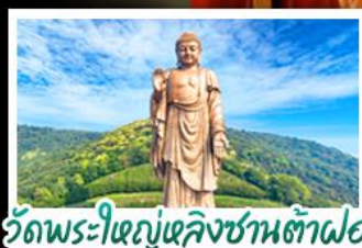
วัดพระใหญ่เฉิงชานต้าฝอ