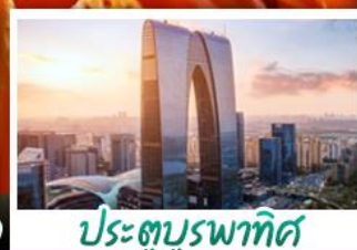
ประตูบูรพาทิศ