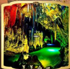
ถ้ำน้ำเป็นซี