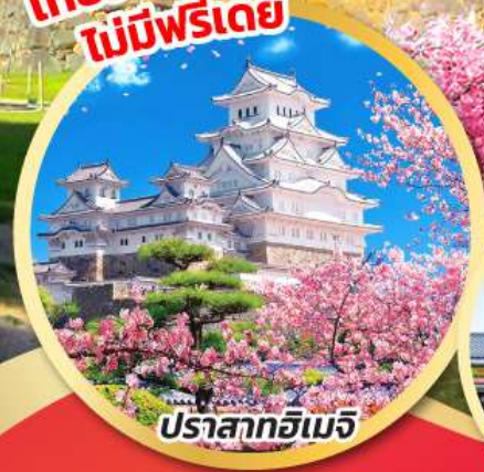
ปราสาทอิมเมจิ