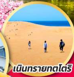
เป็นทรายทตโตริ

ขอพรเทพเจ้าแห่งความรัก พร้อมชมซากุระ ณ ศาลเจ้าอิซุโมะ โทซะ