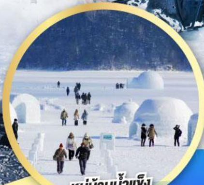
หมู่บ้านน้ำแข็ง แห่งทะเลสาบชิคาริเบ็ตสึ