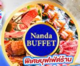
พิเศษบุฟเฟ่ต์ร้าน NANDA ตักสุดในชิบิโปโร