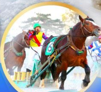
สนามม้าบับอะโทคาจิ