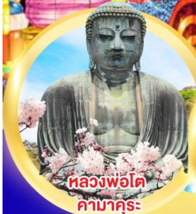
หลวงพ่อโต คามาคูระ

ชมงานประดับไฟ 1 ใน 3 ของญี่ปุ่น อิซุโคเก็น แกรนอิลูมิ