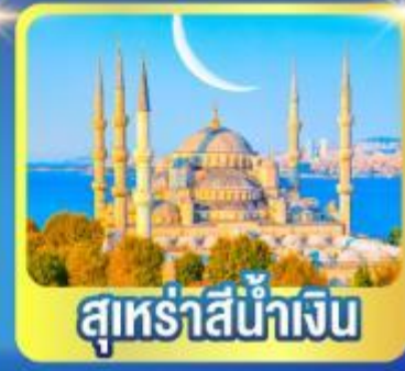
สุหรัสน้ำเงิน