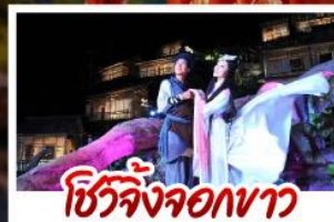
ชีวิตจิ้งจอกขาว