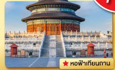
★ หอฟ้าเทียนถาน