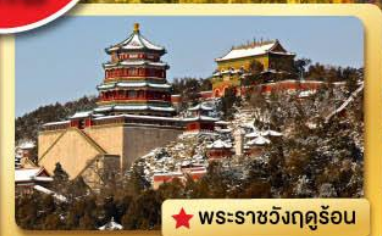
★ พระราชวังฤดูร้อน