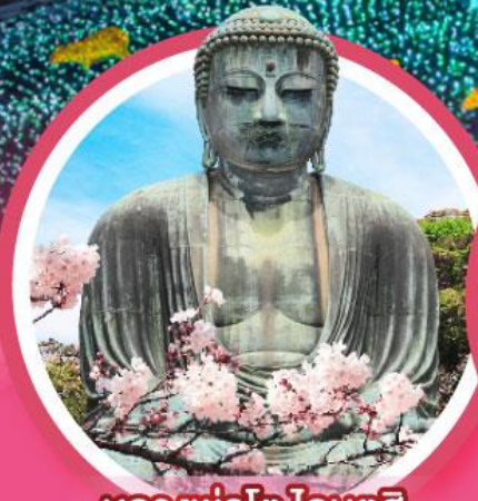
หลวงพ่อดโตโดบุตสึ

ชมเทศกาลดอกซากุระบานในคาวาซุ ชมงานประดับไฟ 1 ใน 3 ของญี่ปุ่น อิซุโคเก็น แกรนด์อิลลูมิ พักออนเซ็น 2 คืน/ พักโตเกียว 2 คืน