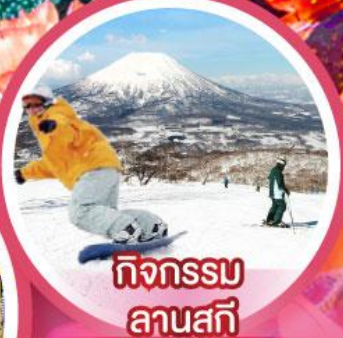
กิจกรรม ลานสกี

เดินทาง 18-23, 21-26 ก.พ. 68 14-19, 20-25 ก.พ. 68