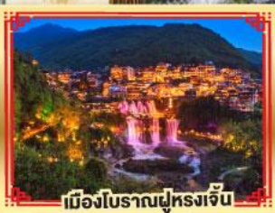
เมืองโบราณฟูหลงเจิ้น