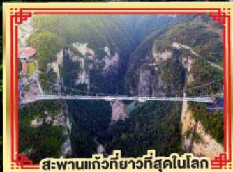
สะพานแกว่งที่ยาวที่สุดในโลก