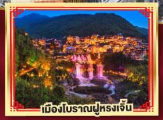
เมืองโบราณฟูหลงเจิน