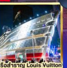
เรือสำราญ Louis Vuitton