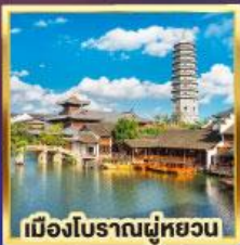
เมืองโบราณผู้ทวยวน