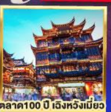
ตลาด100 ปี เิงหวังเมี่ยว