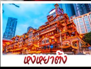
แองเฉาตั้ง