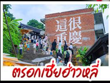
ตรอกซี้ย๋อวหลี่