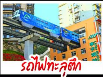
รถไฟทะลุคิก