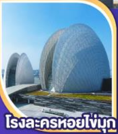
โรงละครหอยโข่งมุก