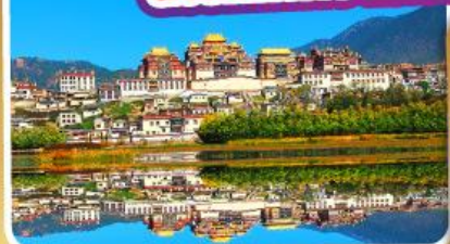
วัดลามะ-ชงจ้านหลิง