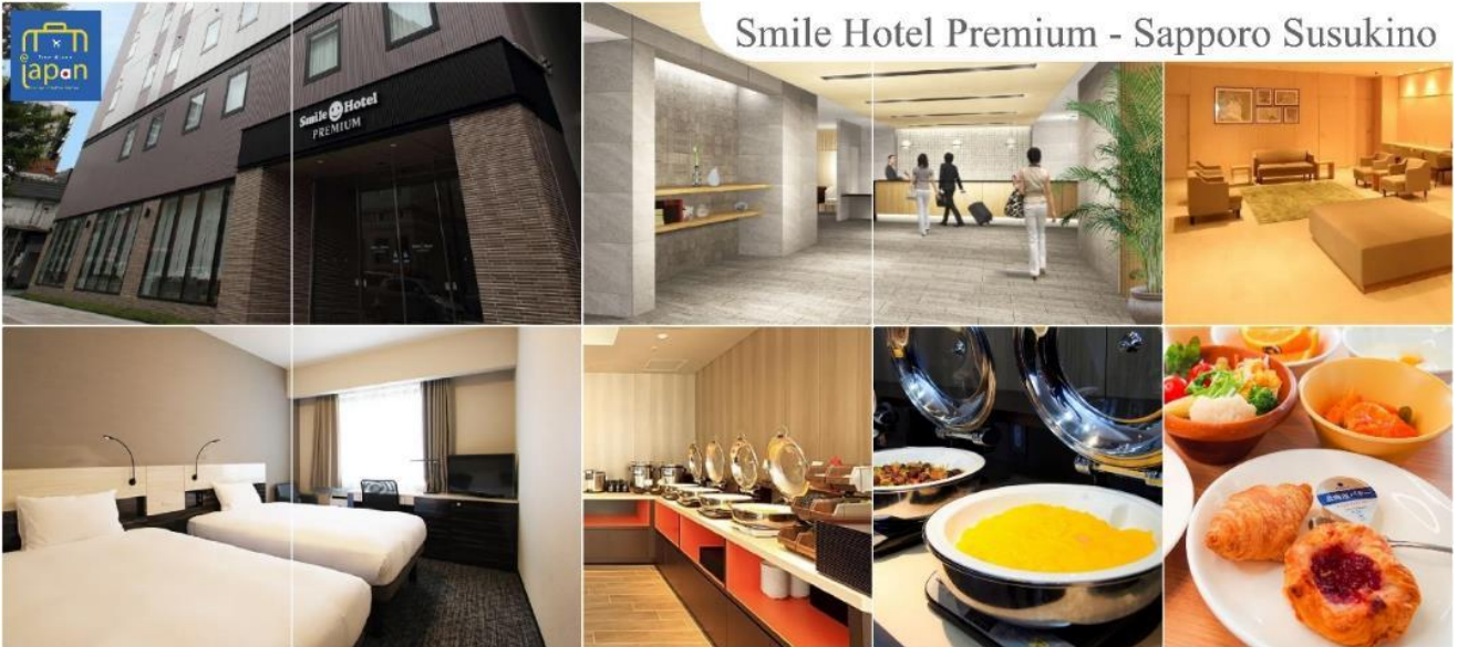
Smile Hotel Premium - Sapporo Susukino

รับประทานอาหารเย็น ณ ภัตตาคาร (3) พิเศษ!!! เมนู บุฟเฟต์ซาบุมุ + ซาบุมุ SMILE HOTEL PREMIUM - SAPPORO SUSUKINO หรือเทียบเท่าระดับเดียวกัน