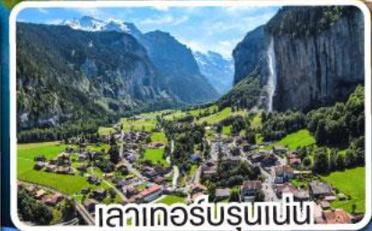
เลาเกอร์บรุนเนน