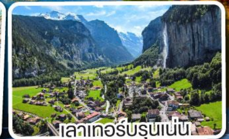
เลาเทอร์บรุนเนน