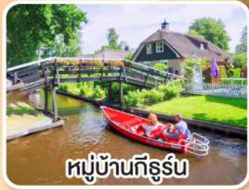
หมู่บ้านกีร์น