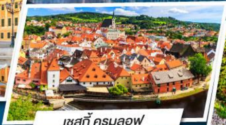
เชสกี ครูมลอฟ