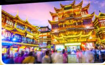
ตลาดร้อยปีเฉิงหวังเมี่ยว