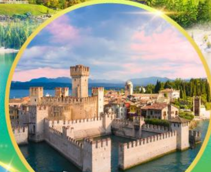
ซีร์มิโอเน