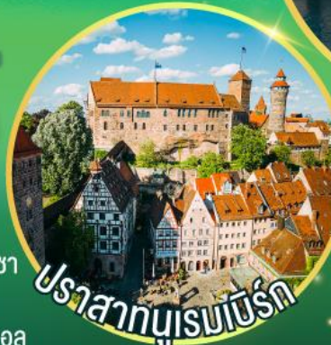
ปราสาทบูเรนเบิร์ก