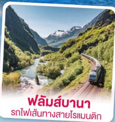
พหลิมส์บานา รถไฟเส้นทางสายโรเมนติก