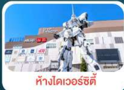
ห้างไดเวอร์ซิตี