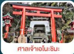
ศาลเจ้าอินะชิมะ