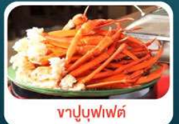
ชาบูบุฟเฟ่ต์