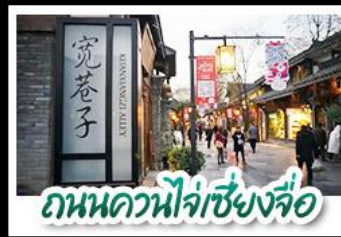
ถนนควนโจเซียงจื่อ