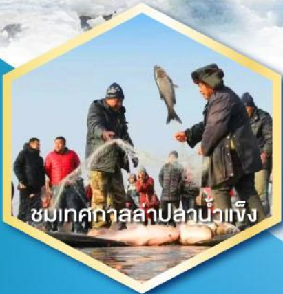
ชมเทศกาลปลาแม่น้ำเข็ง

ฟรี ถุงมือ หมวก ผ้าพันคอและถุงร้อน ท่านละ 1 ชุด !!