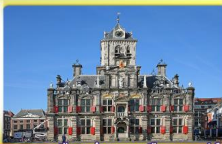
อาคารเมืองเก่าคลองเมืองเคลฟท์