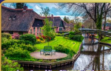
ล่องเรือหมู่บ้านไรกันนทีร์รูน