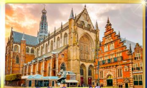
จัตุรัสเมืองฮาร์เล็ม

พรมแดนเมืองแปลกเนเธอร์แลนด์และเบลเยียม เดินเมืองเคลฟท์ เมืองเครื่องปั้นดินเผาระดับโลก ฮาร์เล็มเมืองมั่งคั่งที่สุดของเนเธอร์แลนด์