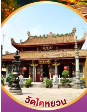
วัดโคทหยวน