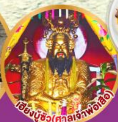
เสี้ยงบู๊ซัว (ศาลเจ้าพ่อเสือ)