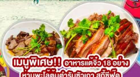
เมนูพิเศษ!! อาหารแต่จิว 18 อย่าง ห่านพะโล้ต้นตำรับซิวเถา สุกีชีฟู๊ด