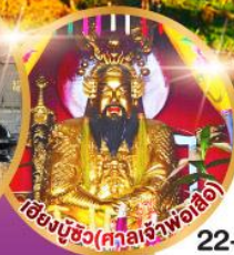
เซียนบูซิว (ศาลเจ้าพ่อเสือ)