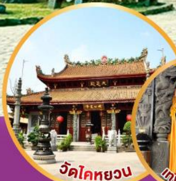
วัดโคตหยวน