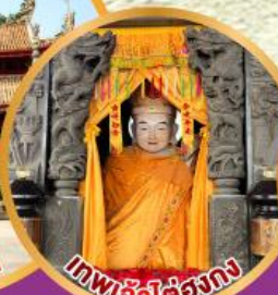
เทพเจ้าไต่ซงกง