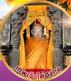
เทพเจ้าไค่ชองกง