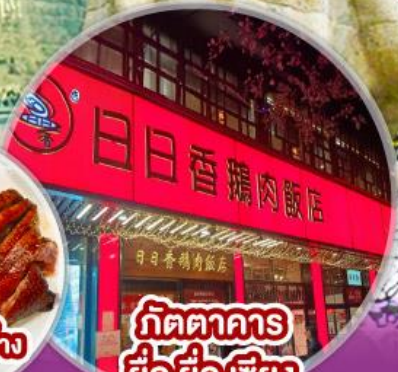
ภัตตาคาร ยี่ ยี่ เชียง