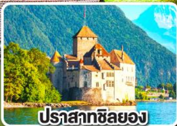
ปราสาทซิลยอง