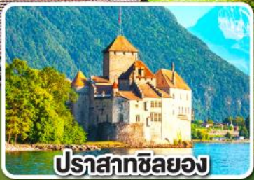
ปราสาทชิลยง