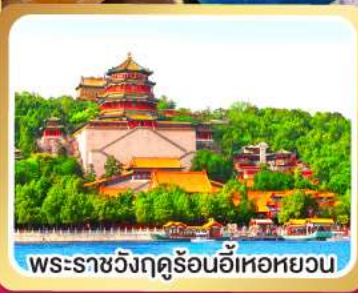
พระราชวังฤดูร้อนอี่หออหยวน