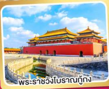
พระราชวังโบราณถู่กิง