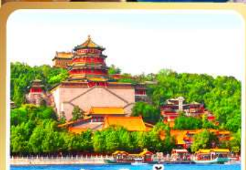
พระราชวังฤดูร้อนอี่เหอหยวน