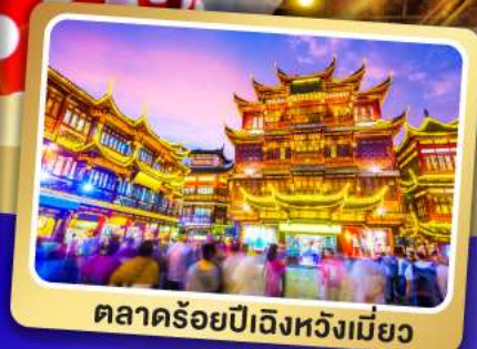
ตลาดร้อยปีเฉิงหวังเหมียว