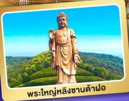
พระใหญ่หลังซานต้าฝอ