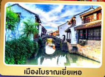
เมืองโบราณเยี่ยเหอ